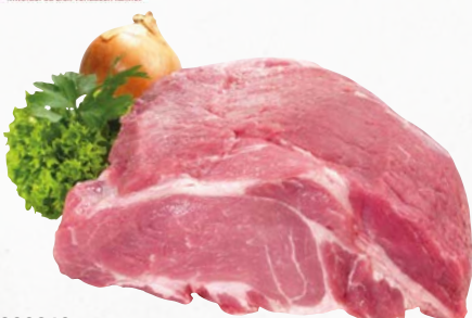
829312 Schweine-Nacken ohne Knochen, einzeln vacuum, ca. 2 kg