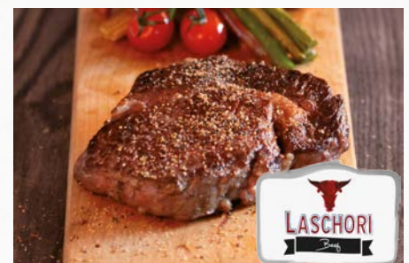
943970 Rinder-Entrecote 2,3 kg, Argentinien, Rib Eye, ca. 15 kg