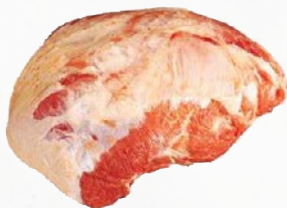
949382 Kalbs-Rücken, ohne Knochen zart, rosa Fleisch, vac., ca. 5 x 3 kg (15 kg)