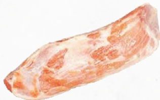
949380 Kalbs-Semerrolle zart, rosa Fleisch, vac., ca. 12 x 1,2 kg (15 kg)