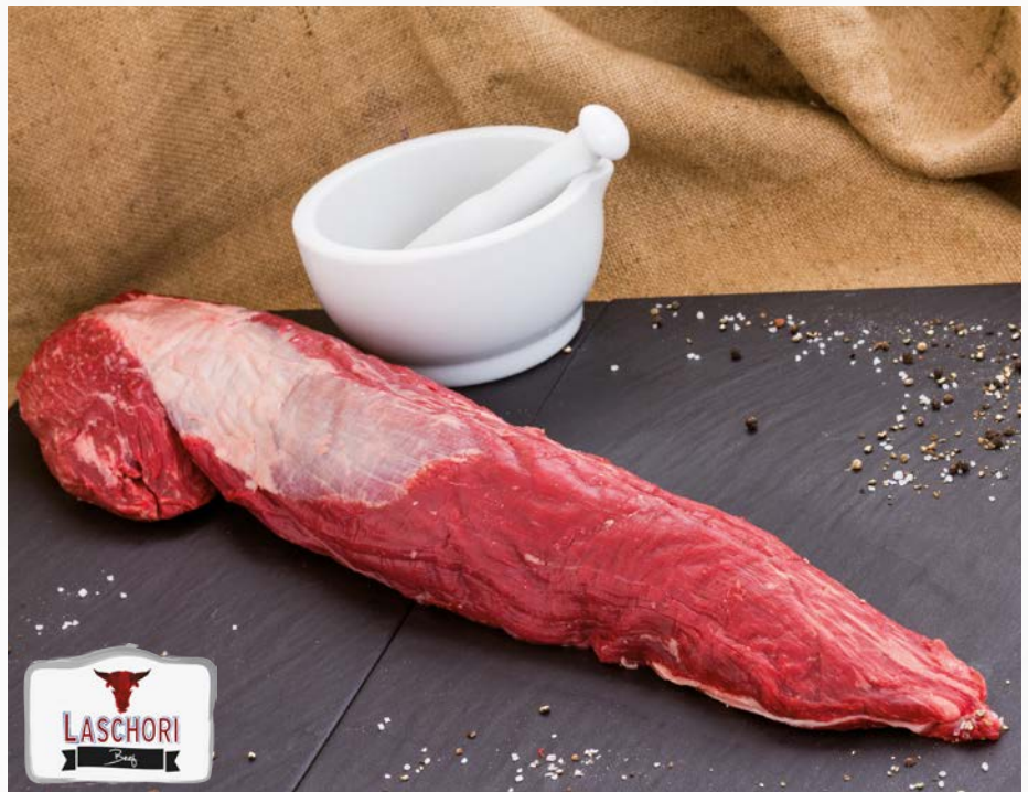
944519 Rinderfilet, 3 - 4 lbs Argentinien, ca. 12 kg