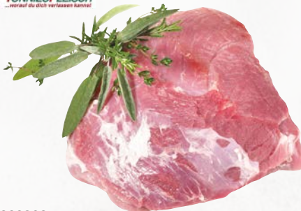
829308 Schweine-Oberschale ohne Deckel, ca. 2 kg