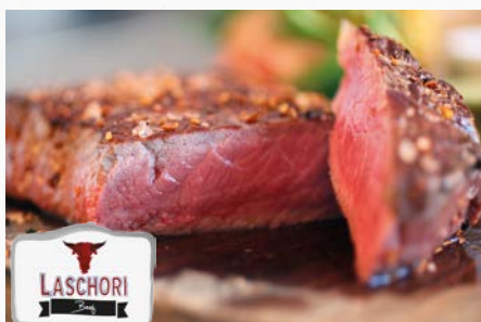
944514 Rinder-Roastbeef 4 kg, Brasilien, steak ready, ca. 12 kg