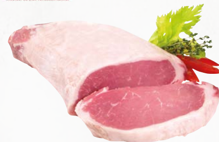
829324 Schweine-Rücken mit Kette, einzeln vacuum, ca. 4 kg