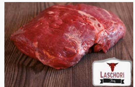
944524 Rinder-Steakhüfte 2,3 kg, Argentinien, ohne Deckel, ca. 12 kg

Die tiefrote Farbe geht einher mit feiner Fettmaserung und Zartheit – freuen Sie sich auf den exzellenten Genuss!