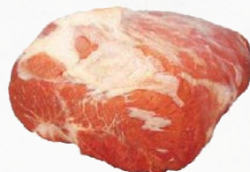
949381 Kalbs-Oberschale, ohne Deckel zart, rosa Fleisch, vac., ca. 6 x 2,5 kg (15 kg)