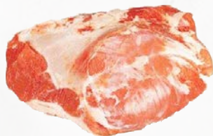
949383 Kalbs-Steakhüfte zart, rosa Fleisch, vac., ca. 10 x 1,5 kg (15 kg)