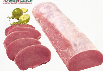
829313 Schweine-Lachse ohne Kette, einzeln vacuum, ca. 4 kg