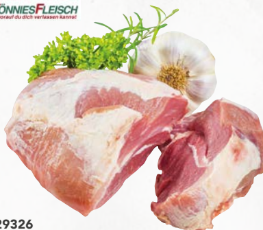
829326 Schweine-Schulter schier, einzeln vacuum, ca. 3 kg