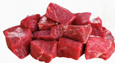
829379 Rinder-Gulasch 1 kg