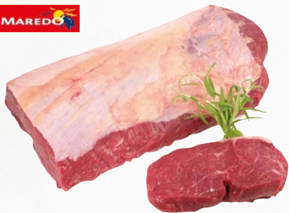
943950 Rinder-Roastbeef „Maredo“ 4 kg, Argentinien, ohne Kette, ohne Kappe, ca. 15 kg