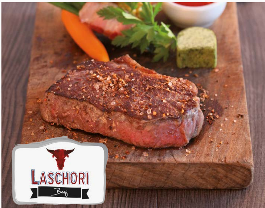
944516 Rinder-Roastbeef Premium Plus 4 kg, Argentinien, extrem sauber pariert, ca. 12 kg